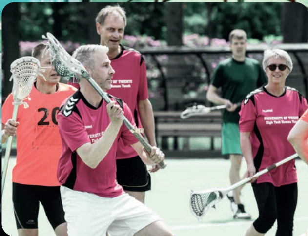
Sportieve middag 2018