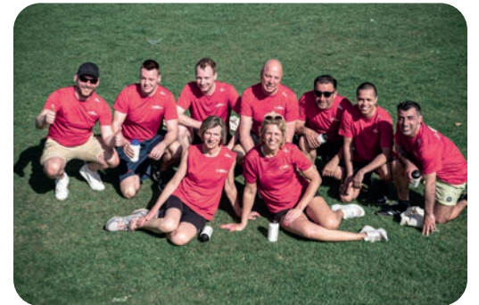
Sportieve middag 2018