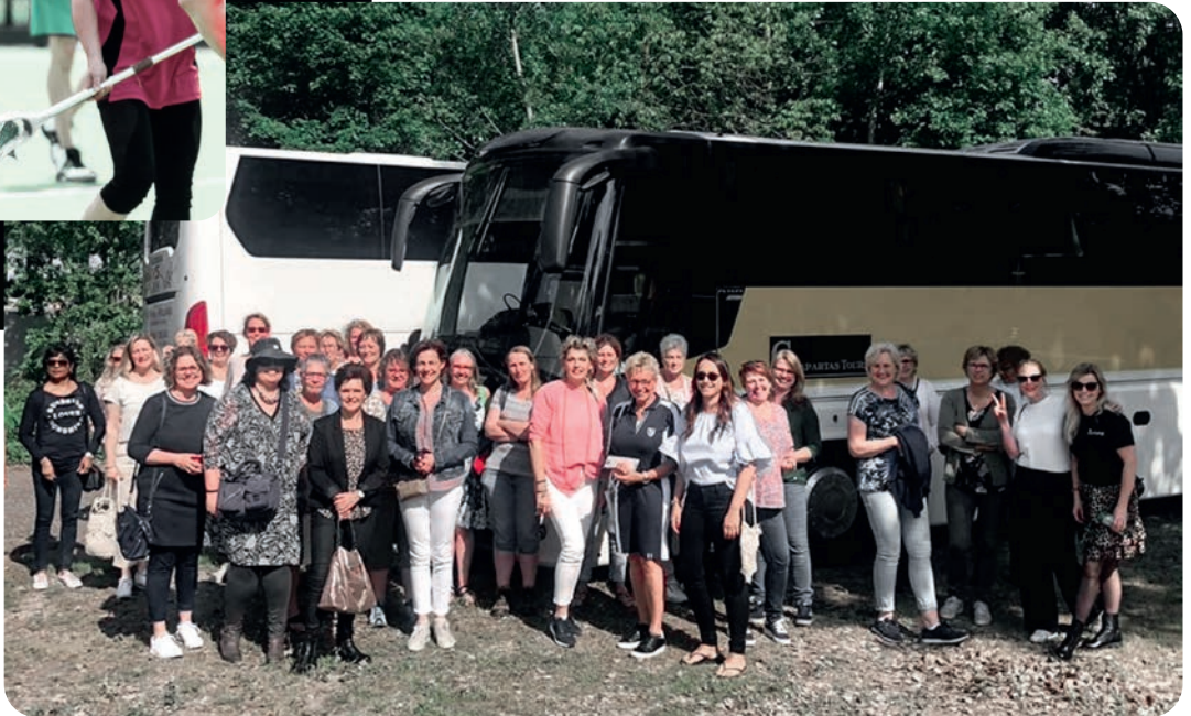
Libelle zomerweek 2019