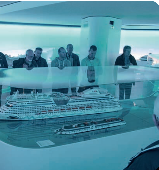
Bezoek scheepswerf Meyerwerft 2017