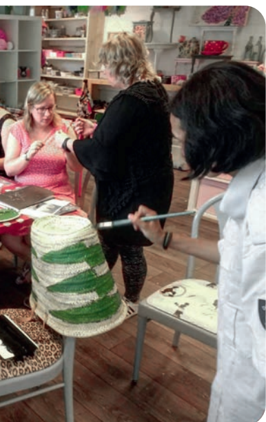
Ibiza workshop 2019