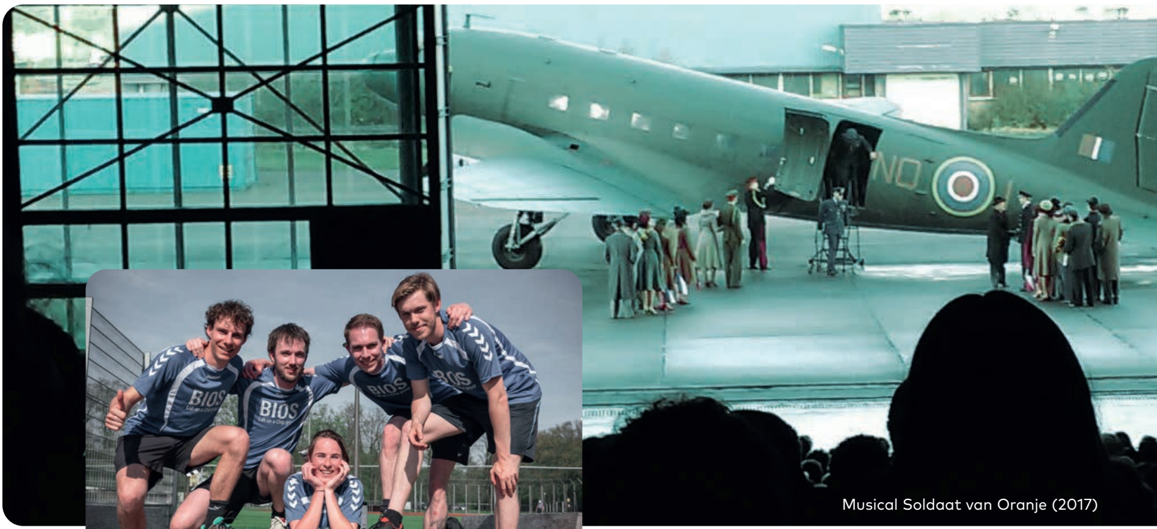
Musical Soldaat van Oranje (2017)