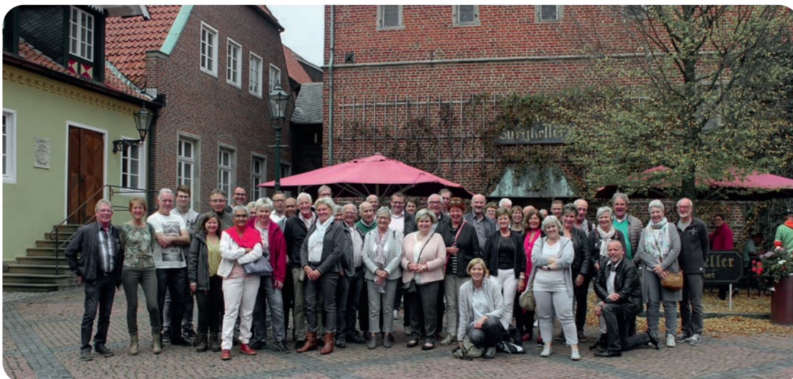
Bezoek Apfelkorn Berentzen