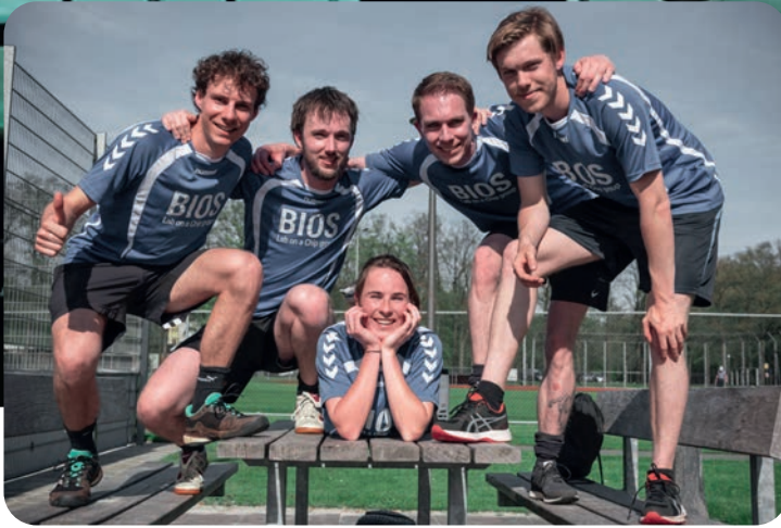
Sportieve middag 2018